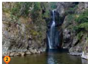
暁嵐の滝 佐伯市上浦大字浅海井浦 TEL 0972-32-3111 (佐伯市上浦振興局) 全国的にもまれな海岸からわずかに 500m 足らずに位置する瀧です。およそ 14m の断崖から流れ落ちる瀧のさまは広瀬淡窓も絶賛したと云われます。

国内最大級の夫婦岩・豊後二見ヶ浦は、高さ 17m の男岩と高さ 10m の女岩が、長さ 65m、直径最大 75cm、重さ 2t のしめ縄で結ばれている夫婦岩で有名。このしめ縄の長さは日本一で、1994 年にはギネスブックにも紹介されている。初日の出の名所として有名であり、毎年 12 月の第 2 日曜日には新年に備え住民によってしめ縄が架け替えられる。元旦には、甘酒等が振る舞われる。年末から年始にかけてはライトアップも行われる。