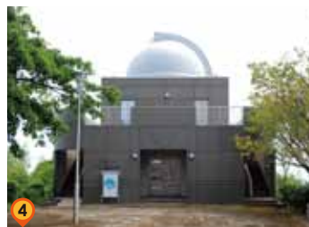
天海展望台 (てんかいてんぼうだい) 佐伯市上浦大字津井 TEL 0972-32-2700 (川元建設工業) 天体観測室にはドイツ式 300mm 反射望遠鏡が設置。昼は佐伯湾と豊後水道を一望、夜は美しい星空を楽しむことができます。天体観測は予約制