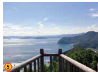
蒲戸崎展望台 佐伯市上浦大字勝海浦 (いいなめうら) TEL 0972-32-3111 (佐伯市上浦振興局) 佐伯市上浦の最東端、日豊海岸国立公園の一角の「蒲戸崎自然公園」。豊後水道のほぼ中央に位置する蒲戸崎に「蒲戸崎展望台」があります。ウバメガシヤスタジイの自然林。