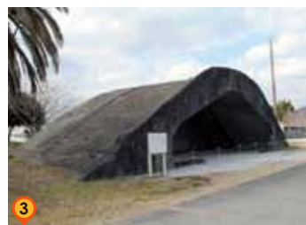
掩体壕(えんたいごう) 佐伯市東浜 1-6 興人(株)佐伯工場内 TEL 0972-23-3400(観光案内所)

軍都佐伯の歴史から平和な世界を築くための考える場として設立。 ●閉館時間：9：00～17：00 ●休館日：月曜日 ●観覧料：個人：大人 300 円小・中学生 100 円