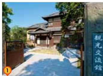
城下町観光交流館 佐伯市城下東町8-19 TEL 0972-28-5656

城山登山 佐伯市大手町1丁目 TEL 0972-23-3400 (佐伯市観光案内所) 佐伯市街のほぼ中央、標高144mにシイの木で覆われている城山。登り口は4つあり独歩碑の道、登城の道、翠明の道、若宮の道とそれぞれ四季折々の風景が楽しめます。