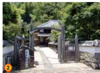
国木田独歩館 佐伯市城下東町9番37号 TEL 0972-22-2866

佐伯藩2万石城下町の武家屋敷通りの面影が残る「歴史と文学のみち」の一角にあります。昭和11年建築の「つたや旅館」を改修保存。気軽に休憩でき無料開放しています。