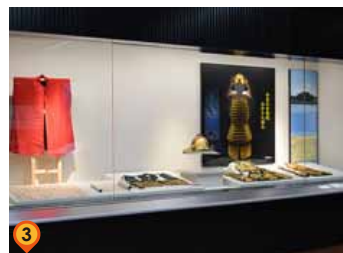
佐伯市歴史資料館 佐伯市大手町1丁目2番25号 TEL 0972-22-0700